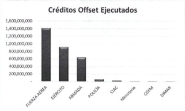
Gráfico 2. Beneficiarios de Convenios Derivados de Cooperación Industrial y Social – Offset