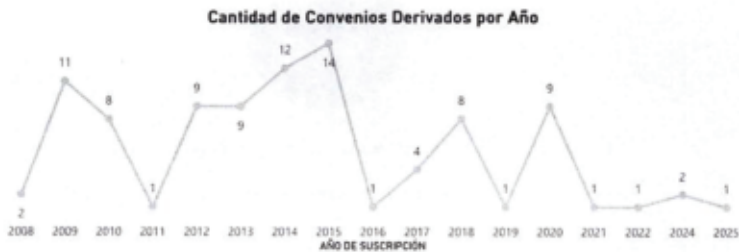
Gráfico 4. Convenios Derivados Offset suscritos por año