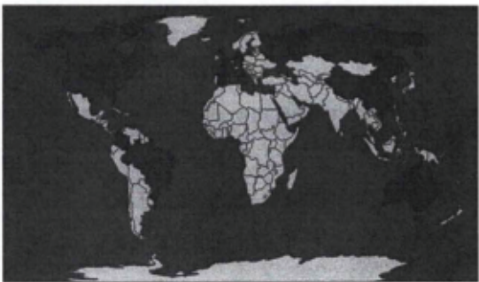
Gráfico 3. Convenios Marco por empresas de acuerdo con su país de origen